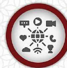
سایت و شبکه‌های اجتماعی