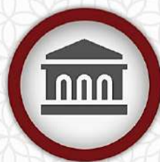
تعامل با دستگاه‌ها